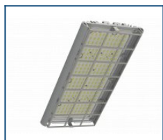
Решётка защитная Unit/Angar D90